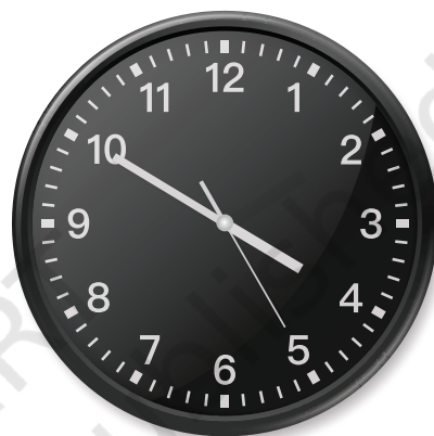
मॉरिशस में घड़ी