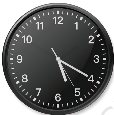
भारत में घड़ी

इन घड़ियों के अनुसार नीचे दिए गए प्रश्नों के उत्तर दीजिए—