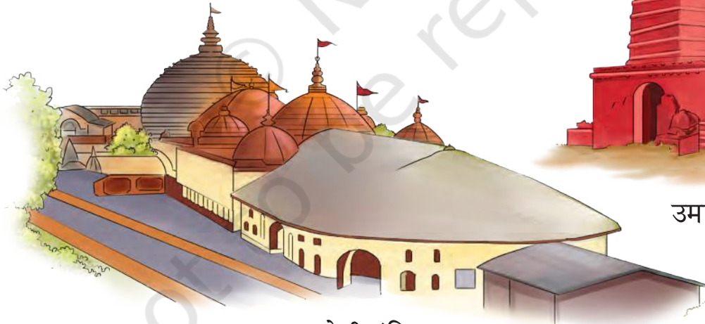
कामाख्या देवी मंदिर